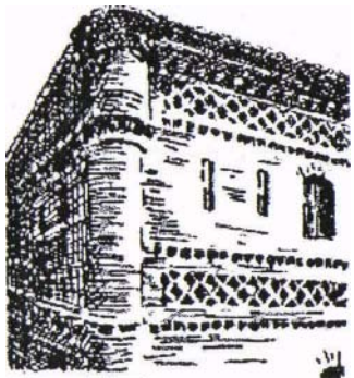
Château de Loyola